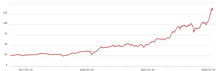
B 配息型-新台幣(成立日：113/12/12)